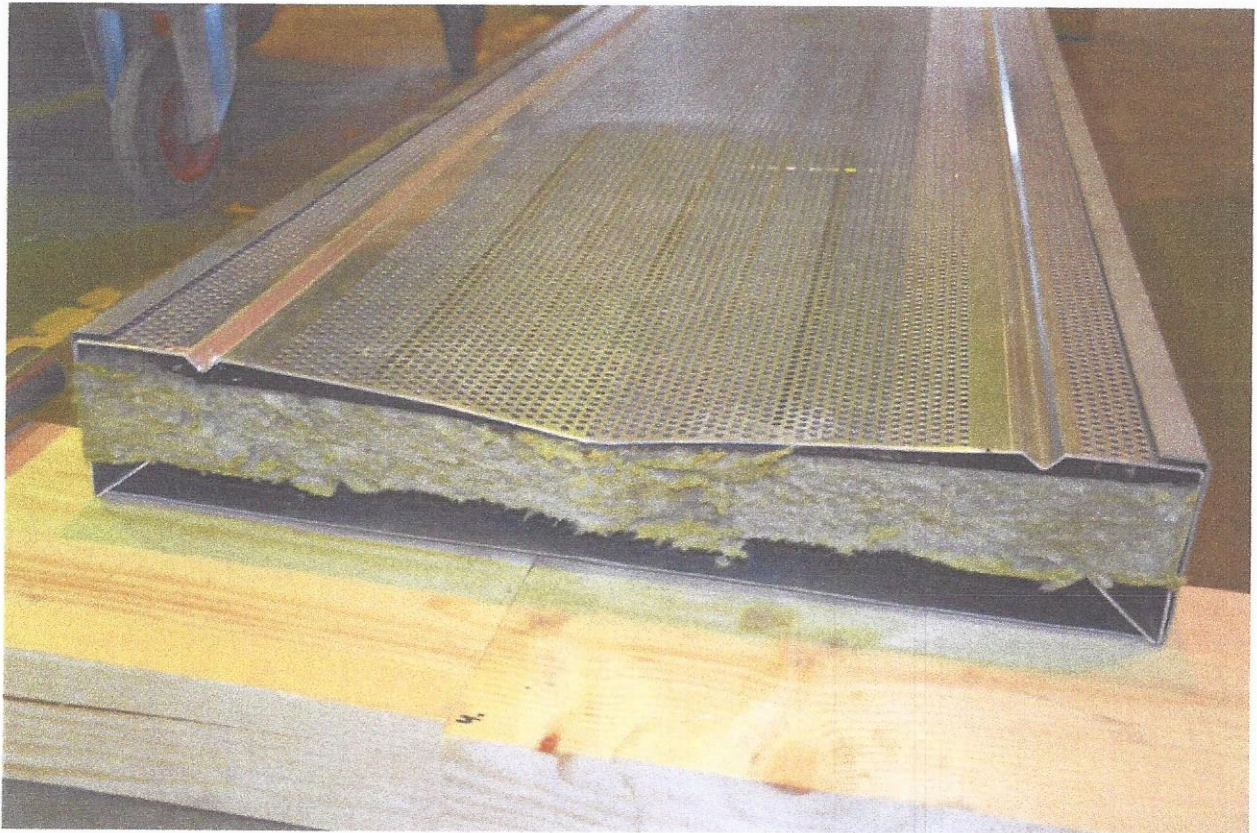
Figure 6 – Impact au milieu d'un bord de l'échantillon