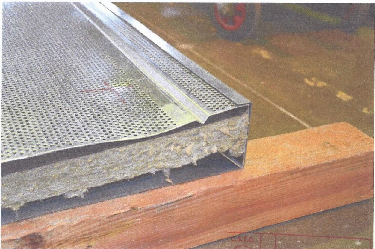
Figure 5 – Impact près d'un coin de l'échantillon